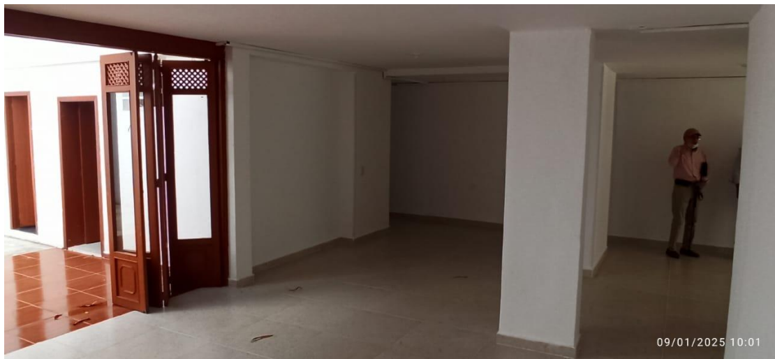
Figura 4. Primer piso