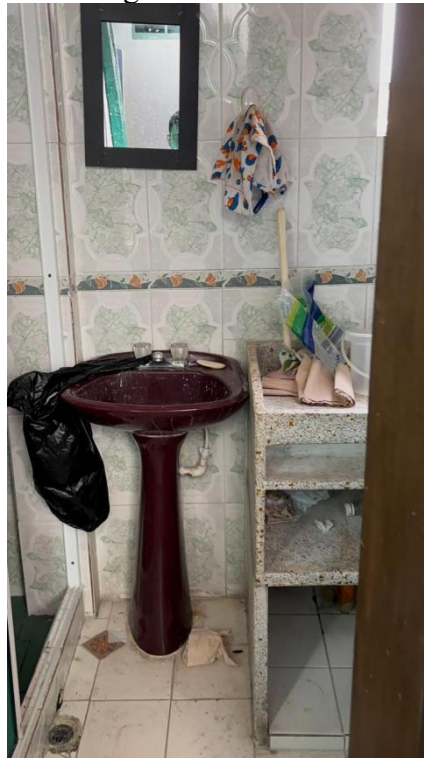
Figura 13. Baño