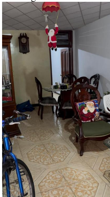
Figura 9. Sala