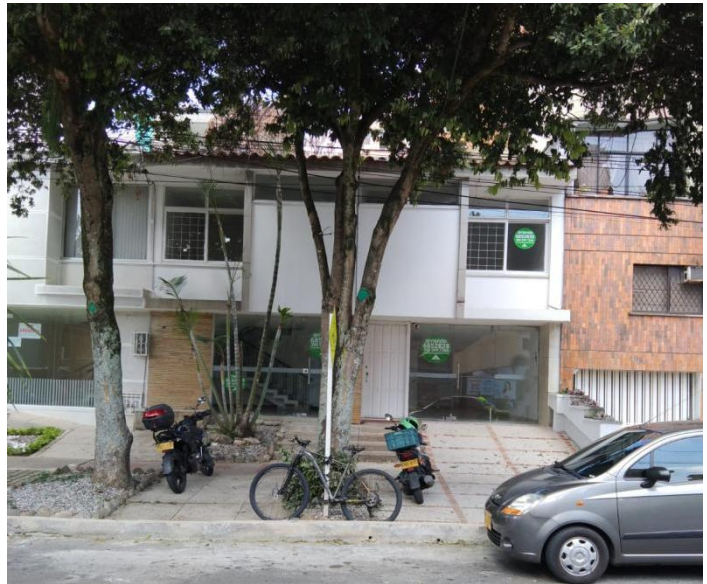
Figura 1. Fachada de la edificación