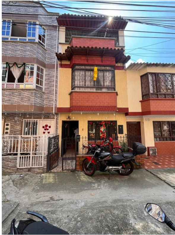
Figura 8. Fachada