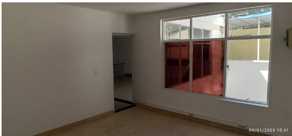
Figura 7. Cuarto 2