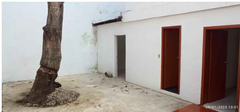
Figura 2. Patio