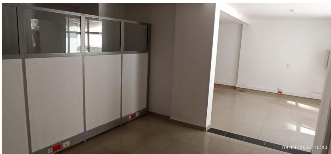
Figura 6. Segundo Piso