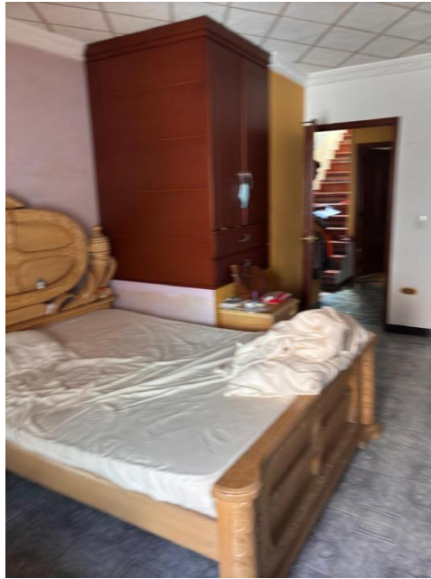
Figura 10. Habitación 1