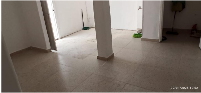
Figura 3. Cuarto 1