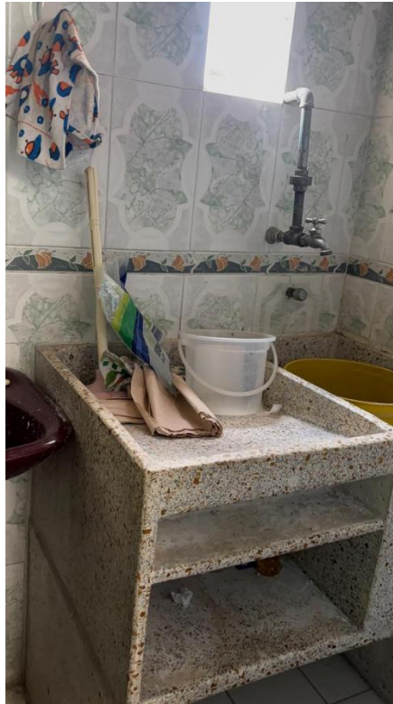
Figura 14. Lavadero