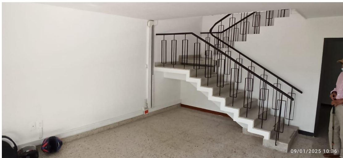
Figura 5. Escaleras